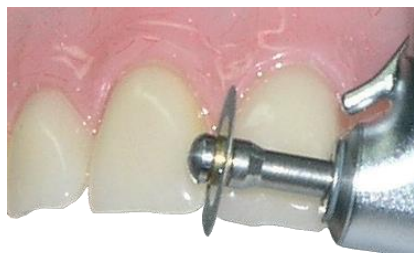
*Ejemplo de muestra