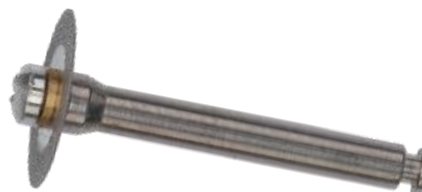
*Imágenes de muestra