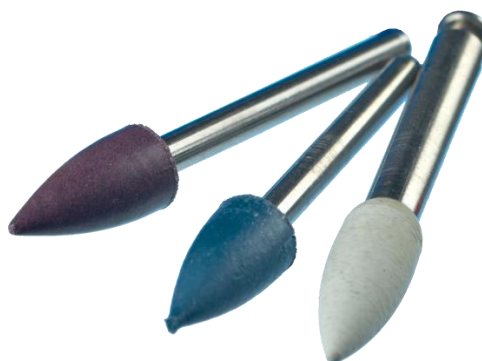
*Imágenes de muestra