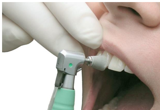
*Ejemplo de muestra